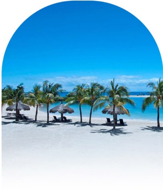
BLUE WATER MARIBAGO BEACH RESORT 4* DELUXE ROOMS