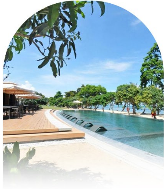
ASTORIA PALAWAN 5* DELUXE ROOMS