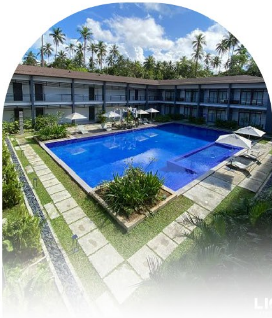
HUNI LIO 4* DELUXE ROOMS